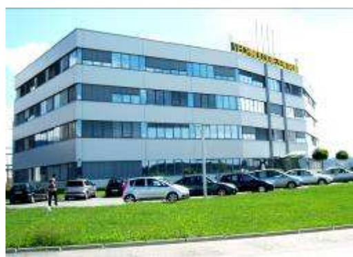
Nowoczesny Instytut Technologiczny