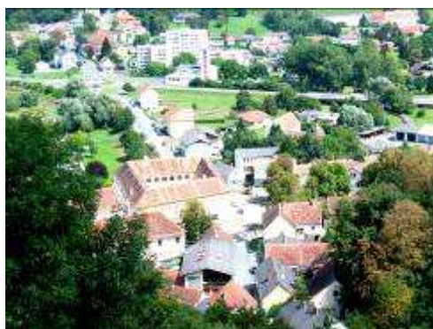
Rzut oka na miasteczko