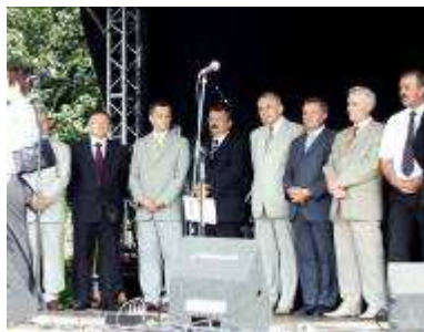
Prominenci też obrodzili