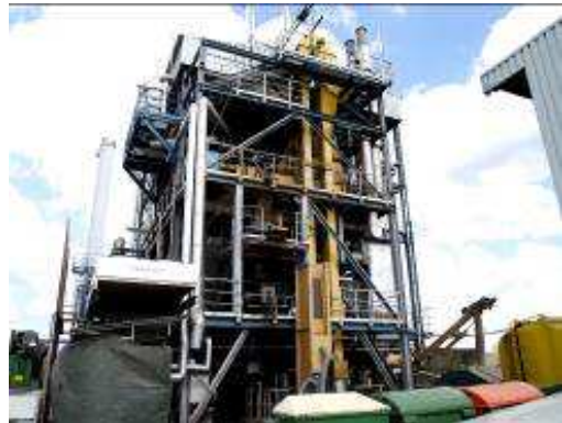
Uczestnicy studyjnego wyjazdu zwiedzają centralną wiejską elektrociepłownię opalaną zrębkami drewna