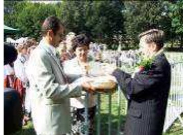
Starosta dzielił bochen