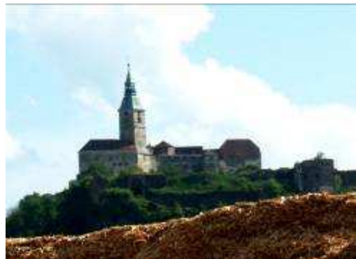
Widok na zamek w Güssing

„Aby uwierzyć, trzeba zobaczyć na własne oczy i dotknąć” – oto cel studyjnego wyjazdu delegacji Powiatu do Güssing, w którym uczestniczyli wójtowie, członkowie władz gminnych i rolnicy ze wszystkich gmin powiatu miechowskiego. Wyjazd zorganizowało Miechowskie Stowarzyszenie Gmin Jaksa w ramach prowadzonego programu LEADER + Schemat II.3