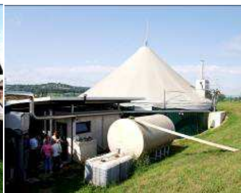
Elementy biogazowni i silnik produkujący energię elektryczną z biogazu