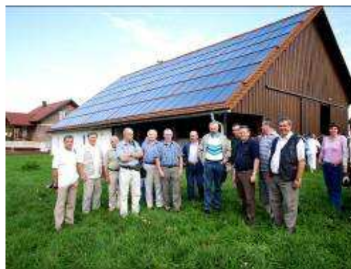
Kolektory słoneczne na wiejskiej stodole