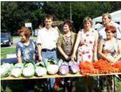
Instytucje rolnicze przeżyły muskuły