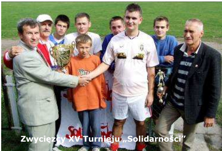
Zwycięzcy XV Turnieju „Solidarności”