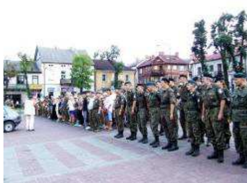
Kadrówka na Rynku