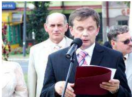
Wprowadzenie historyczne K. Świerczek