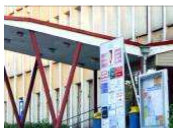
Urząd Gminy i Miasta