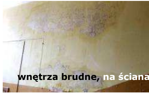
wnętrza brudne, na ścianach grzyb i wypociny „kibiców”