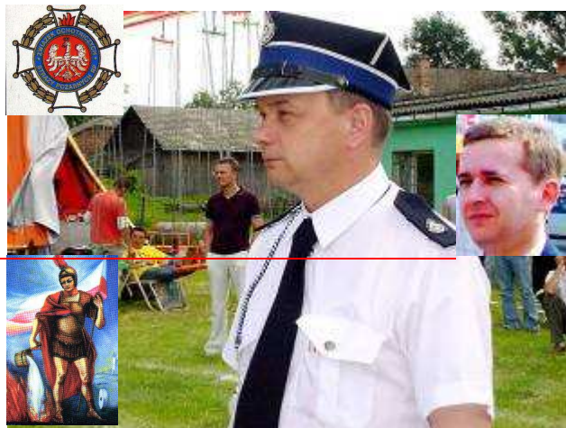
Nowy Prezes i nowy członek. Ci z prawej.

W zdecydowanej większości „byli” nawet nie wiedzieli, że właśnie „ustąpili”. Zarząd Miejsko-Gminny liczy 24 członków. Jak nam policzył zaprzyjaźniony 3-cio klasista 1/3 z 24 wynosi 8. A reformatorom z OSP i Urzędu Gminy wyszło, że 24 : 3 = 9 lub 10. I słusznie! Nie będzie jakiś gówniarz uczył starych chłopów matematyki!