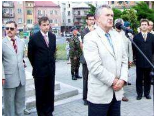
Senator Andrzej Gołaś