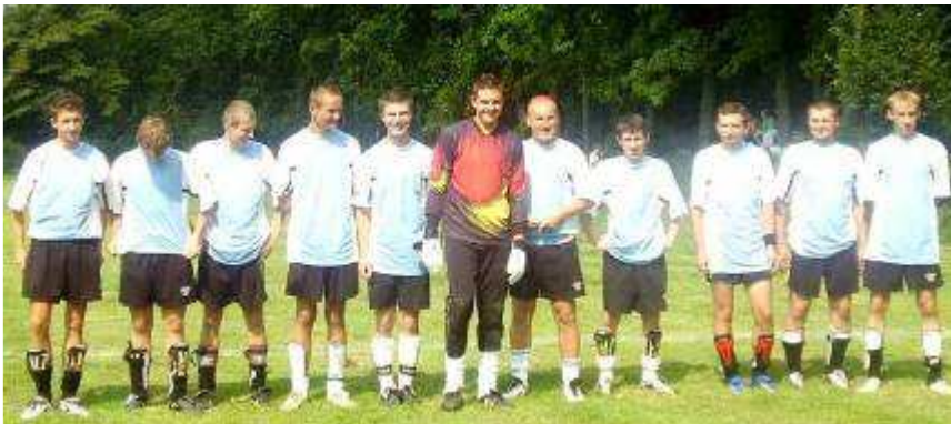
Niezwykle gościnni piłkarze „Błękitnych” Falniów – 4 miejsce