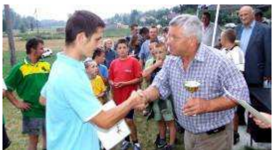
„Northstar” Miechów – 4 miejsce