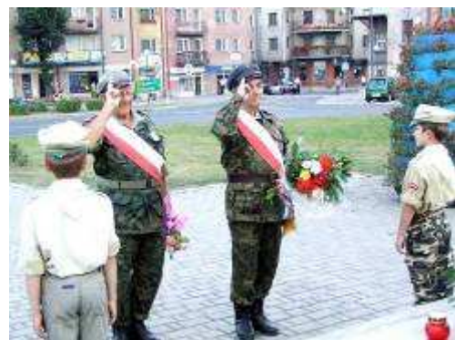
Kwiaty przed Orłem