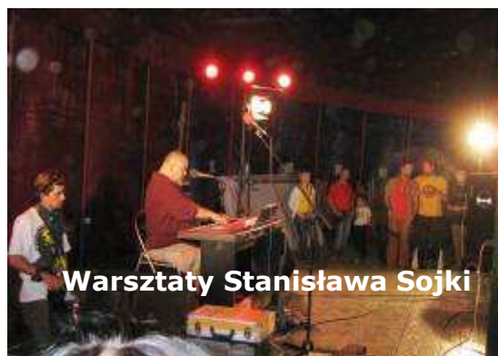
Warsztaty Stanisława Sojki