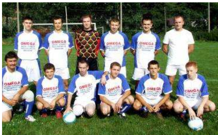
Drużyna „Northstar” Miechów (B klasa)