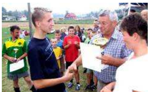
Prezes i kapitan zwycięskiej drużyny