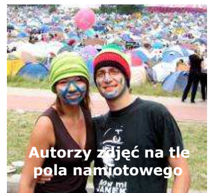
Autorzy zdjęć na tle pola namiotowego