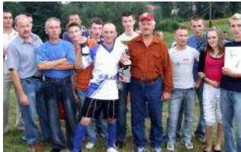
Puchar jest nasz !!!