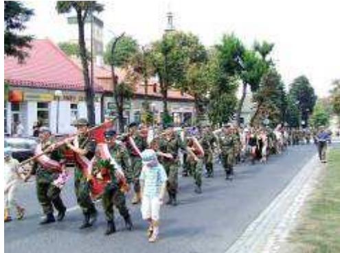
Na czele Marszu poczet sztandarowy