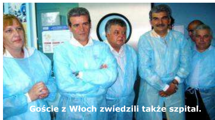
Goście z Włoch zwiedzili także szpital.