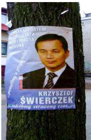
Potem już otwarcie ruszyliśmy na drzewa.