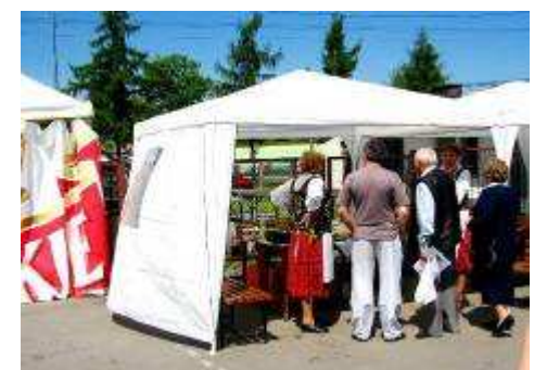
Stoisko Koła Gospodyń Wiejskich