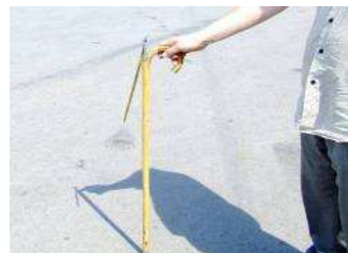
a fachowcy mierzyli poziom frekwencji