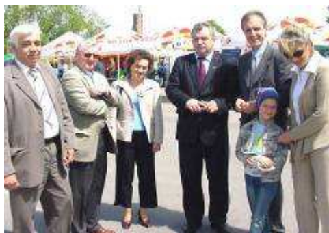
2005r.-Europoseł B. Klich z rodziną