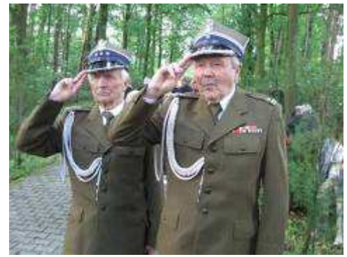
Kombatanci oddali hołd poległym