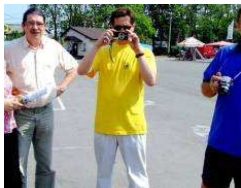
fotoreporterzy pstrykali ...