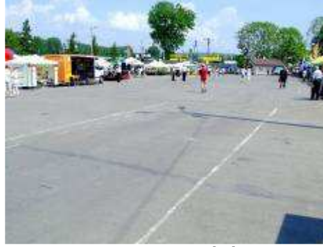
i przybyłych mieszkańców ...