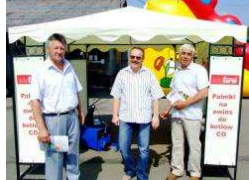
Firma „Termatex” z użytkownikami swoich wyrobów ekologicznych.