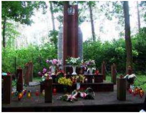
Złożono kwiaty i zapalono znicze