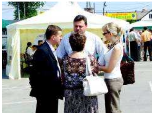
Ekolodzy zawzięcie dyskutowali ...