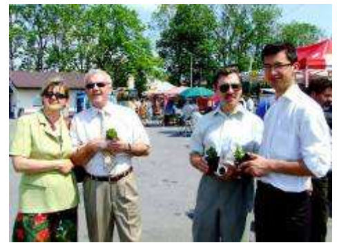
oraz przedstawicieli władz.