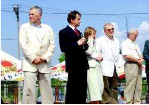
Gospodarz witał gości ...