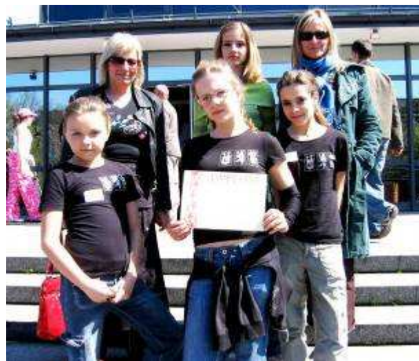
Pamiątkowe zdjęcie z dyplomem