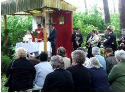
Ks. odprawił mszę

3 czerwca minęła 64 rocznica mordu dokonanego przez hitlerowskich oprawców na ludności Nasiechowic i okolicznych wiosek. Z tej okazji jak co rok odprawiono uroczystą mszę świętą, strażacy zaciągnęli honorowe warty, władze gminne złożyły wieniec a mieszkańcy i goście zapalili znicze i pomodlili się za pomordowanych