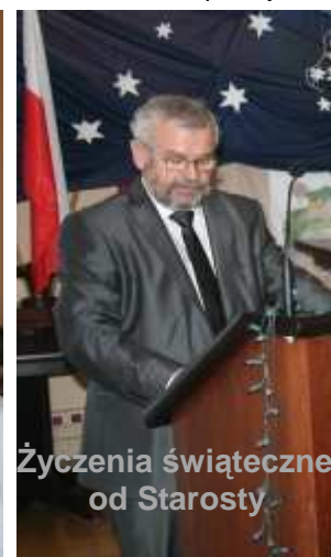
Życzenia świąteczne od Starosty