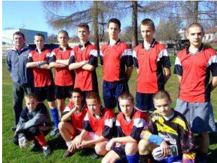
Miechów - 2 miejsce