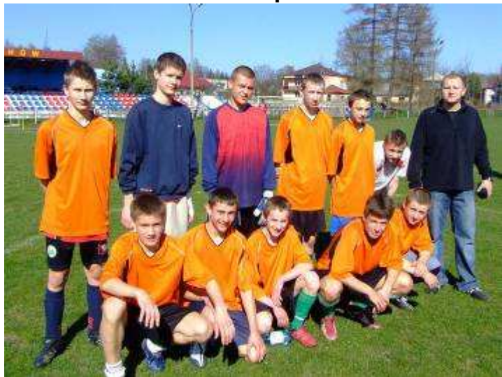
CHARSZNICA - 1 miejsce