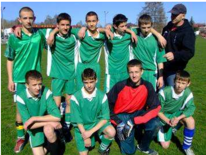
GOŁCZA - 3 MIEJSCE