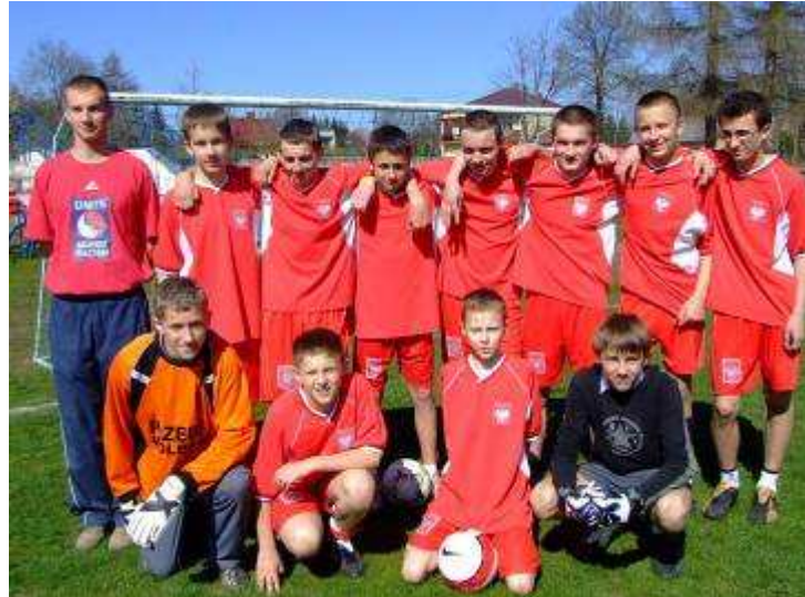
WOLBROM - 4 MIEJSCE