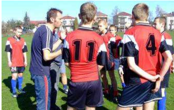
Nie pomogły rady i reprimendy trenera P. Króla