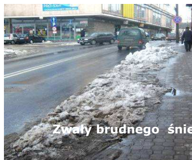
Zwały brudnego śniegu na głównych ulicach miasta.