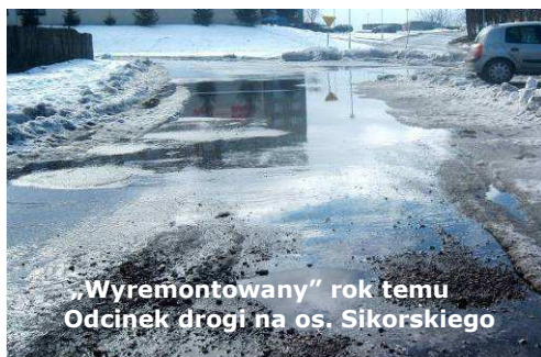
„Wyremontowany” rok temu Odcinek drogi na os. Sikorskiego