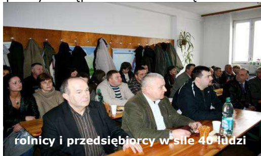
rolnicy i przedsiębiorcy w sile 40 ludzi