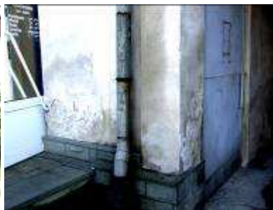
Jak widać więcej obiektów na Pl. Kościuszki niekorzystnie koresponduje. Czy K. Świerczek łąje również Burmistrza?