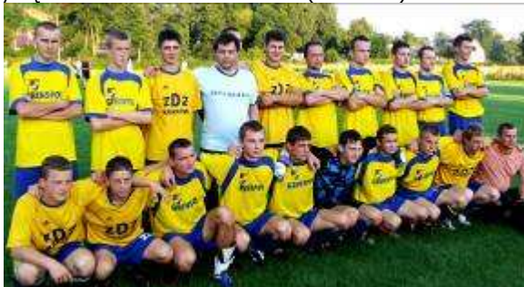
Zwycięska drużyna z Książa Wielkiego.