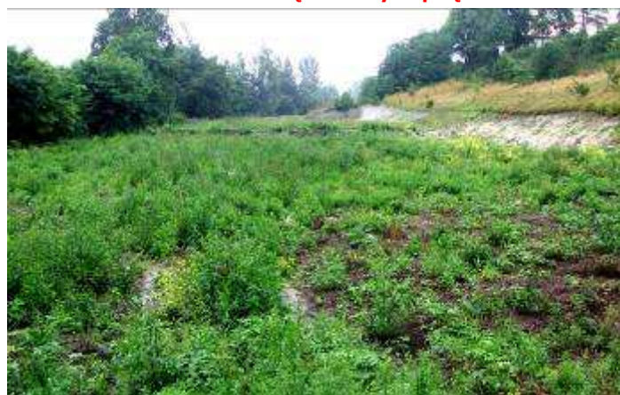
Boisko sportowe w Parkoszowicach