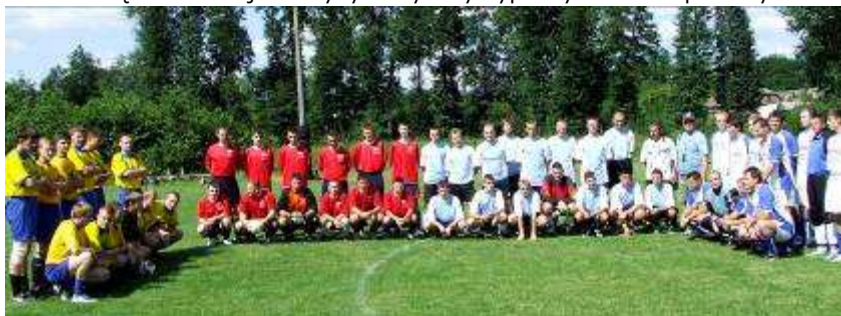
Otwarcie zawodów z udziałem 4 drużyn.