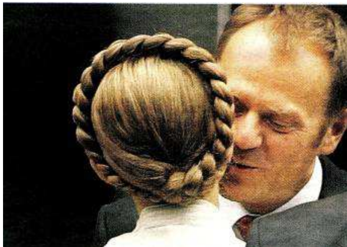
Z cyklu polityk też człowiek : Tylko ich na chwilę zostawić bez żon !