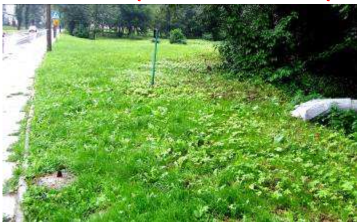
Kryty basen przy ul. Konopnickiej

Słowo się rzekło i ... uciekło! Słowo się dało i ... uleciało! Za słowo wzięli i ... wyciepnęli!