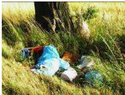
... a w gminie ład, czystość i porządek. Jak zwykle.