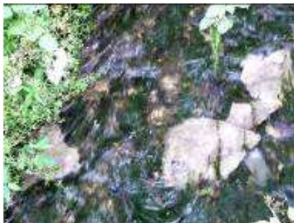
W wypływającej z oczyszczalni ścieków wodzie pływają ryby...