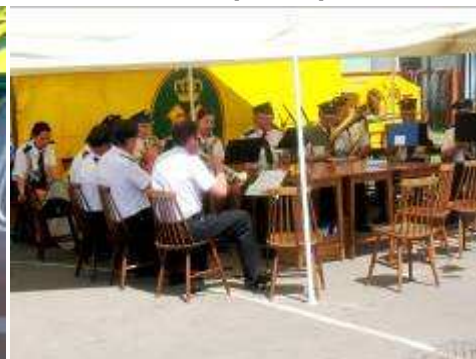
Targi toną a orkiestra gra.