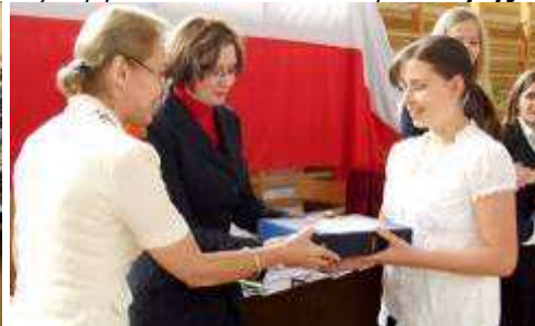
Nagrody dla uczniów, (starannie dobranych...)