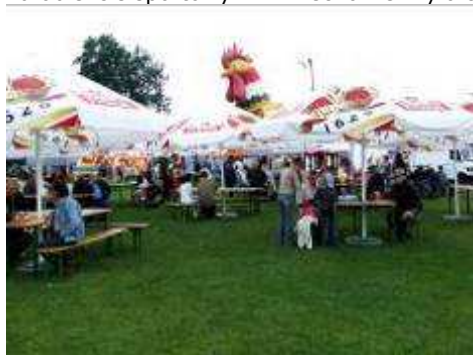
Murawa boiska obficie podlana piwem ...