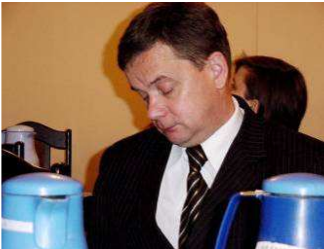
Za tą ciężką harówkę należy mu się chyba te głupie 11 tysiąków no nie ?! (str. 3).