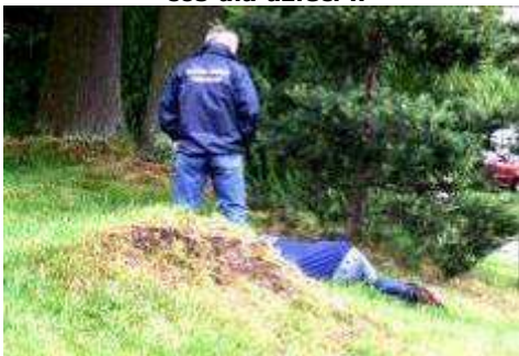
Zmęczenie dawało się we znaki.