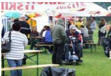
Nadzór nad całością v-ce burmistrz i przew. Komisji Oświaty RM.