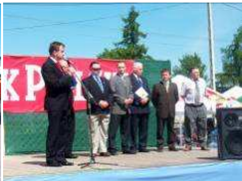
Targi „olali” oficjele ...