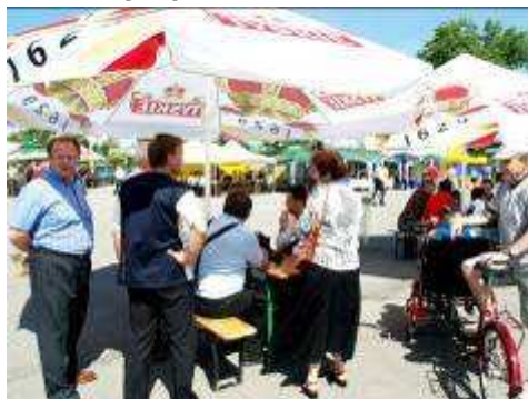
Jak co roku dopisali stali bywalcy.