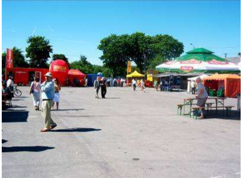
Burmistrz Miechowa robi wszystko aby zniszczyć ekologiczną wizytówkę naszego miasta (str. 6).