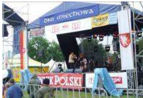
i coś dla ducha czyli MDK.