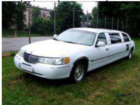
Wóz godny burmistrza.

W dniach 13-15 czerwiec nasze miasto święciło kolejne Dni Miechowa . Gros imprez odbywało się na Miejskim Stadionie. Piwo, i nie tylko, lało się strumieniami jak zawsze na obiekcie sportowym w Miechowie. Było coś dla duszy i coś dla ciała. Zawiodła pogoda.