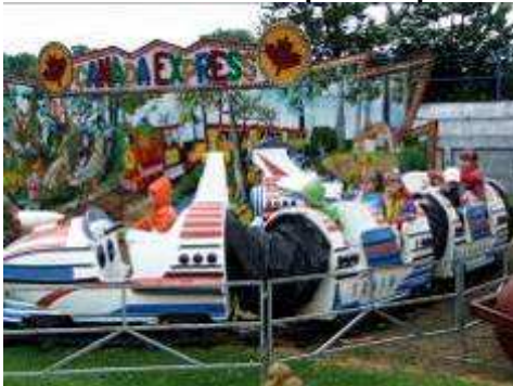
coś dla dzieci ..