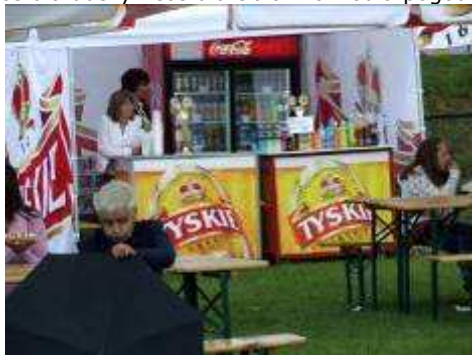
czyli coś dla dorosłych ...