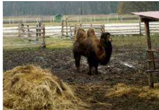
Mini zoo w Kurozwękach - Baktrian