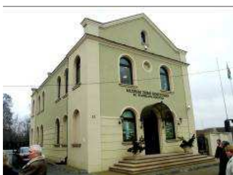
Koszyce - Muzeum