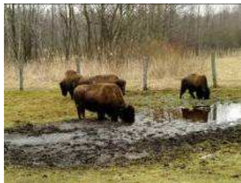
Bizony lubią błocko ...