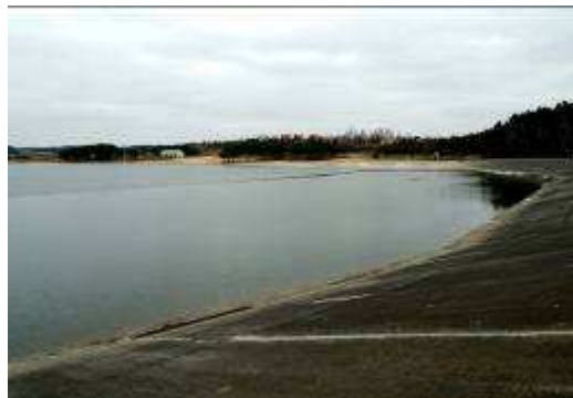
Jezioro Chańcza (k. Staszowa)