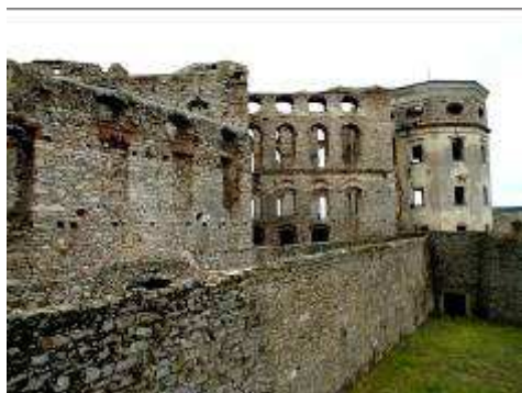
Ujazd - Zamek