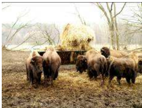
i pachnące polskie sianko