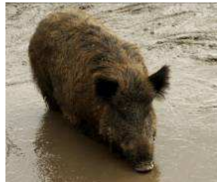
Dzik jest dziki, dzik jest zły ...