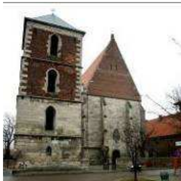
Kolegiata w Wiślicy

Największe zainteresowanie uczestników wyjazdu wzbudziła egzotyczna hodowla wraz z mini zoo w miejscowości Kurozwęki z takimi zwierzętami jak strusie i bizona, które można już tylko zobaczyć w ZOO. Ponieważ na trasie autokaru znalazło się kilka atrakcyjnych miejscowości, uczestnicy łącząc pożyteczne z przyjemnym zwiedzili wiele atrakcyjnych obiektów (vide zdjęcia poniżej) : Muzeum Regionalne w Koszycach, Kolegiatę w Wiślicy, jezioro Chańcza, wspomniane już Kurozwęki czy ruiny zamku w Ujeździe.