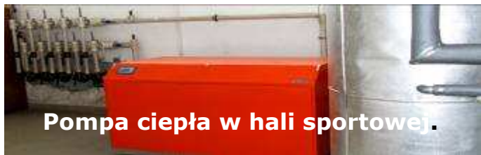
Pompa ciepła w hali sportowej.

Jednak w przypadku dużych obiektów użyteczności publicznej oszczędności pojawiają się już po kilku latach. Energia geotermalna to energia z wnętrza ziemi. Temperatura pod powierzchnią gruntu wzrasta wraz z głębokością a w samym jądrze ziemi osiąga ponad 4 500st. Celsjusza! Już jednak na głębokości 1,5 – 2m pod powierzchnią gruntu jest stała temperatura kilku stopni, którą można wykorzystać do ogrzewania budynków. Na zastosowanie takiego modelu ogrzewania zdecydował się w 2000 roku Burmistrz Gminy i Miasta Miechów Włodzimirz Mielus , entuzjasta