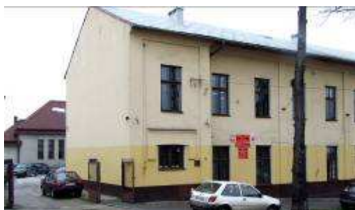
Nowy nabytek powiatu.